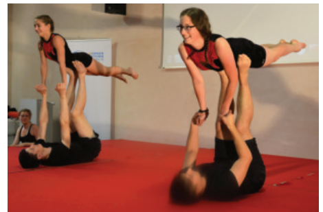
Turner_innen der SpVgg. Rom.