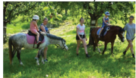
Reiten für Kinder, Reitverein Rom.